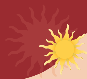
Ihre Vera Stein